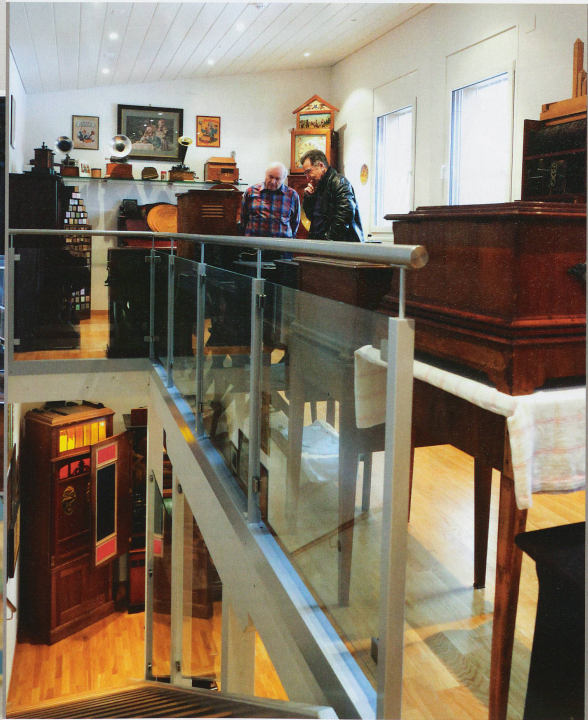
▼ Ein Kleinbasler Hinterhaus voller Trouvaillen

lon, wo sich die «Wunderwelt der mechanischen Musik» seither in ihrer ganzen Pracht und Vielfalt zeigen kann. Auf zwei Stockwerken sind die über 100 Exponate nun ausgestellt, die Musikautomaten, Orchestrien und Harmonien, die Spieluhren, Trichtergrammofone und elektrischen Klaviere, und natürlich die Raritäten wie ein «Rückenklavier» aus Italien oder die «Serinette», mit deren Hilfe früher den Kanarienvögeln das Singen beigebracht wurde. «Alle sind funktionstüchtig», versichert ihr Besitzer, der die dazu nötigen Lochkarten, Walzen, Pfeifen, Platten und Motoren entweder intakt vorgefunden oder selbst wie-