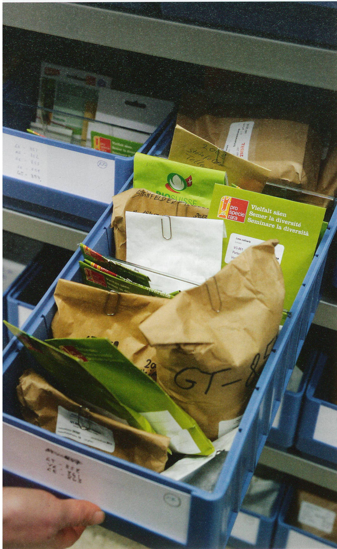
Lokale Vielfalt in Papiertütchen: Pro Specie Rara sammelt regionale Pflanzensorten.

Die Sammlung der 1600 Pflanzensorten ist nicht statisch, sondern dauernd in Bewegung. ▶