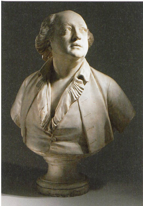
Jean-Antoine Houdon: Büste des Giuseppe Balsamo, genannt Alessandro Graf von Cagliostro, Paris ca. 1786