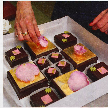
Wencke Schmid und ihre aussergewöhnlichen, essbaren Kunstwerke