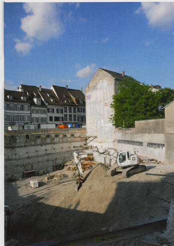
Juni 2013: Blick in die Baugrube.