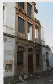
◀ Oktober 2019: Die Ruinen einer 160-jährigen Kleinbasler Tradition. Hier entsteht derzeit der Claraturm.

Doch die Welt der Douglas, Fokker und Jumbolinos wurde ihm bald zu eng. Sein fotografischer Blick umfasste bald die ganze Stadt – und vor allem die Veränderung der Stadt. Mit viel Geduld dokumentiert der frühpensionierte Mechaniker seit über 40 Jahren als Stadtchronist in seiner Freizeit akribisch die kleinen und grossen Baustellen in Basel. Seine Sammlung umfasst einige hundert Schwarz-Weiss- und Farbbilder, etwa 25 000 genau beschriftete Dias sowie rund 100 000 Digitalaufnahmen. Im Moment ist er daran, seinen Bilderschatz zu digitalisieren. Was damit später geschieht, weiss er noch nicht, da seine Kinder kein Interesse an der Sammlung haben.