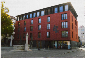
1973 brannte die mittelalterliche Klingental- oder Drachmühle ab. Im ursprünglichen Kubus der Mühle entstand ein Neubau (Silo). Dieser wich 2001 dem Hotel Balade.