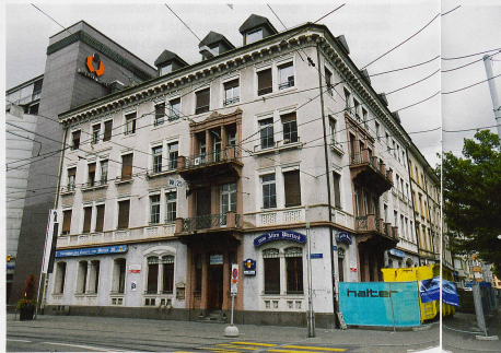
◀ Juli 2018: Der Bauzaun kündigt vom nahen Ende des Restaurants «Altes Wartec» am Riehenring.

www.planungsamt.bs.ch https://klybeckplus.ch www.javoltanord.ch www.wohnen-mehr.ch/index.php/westfeld1