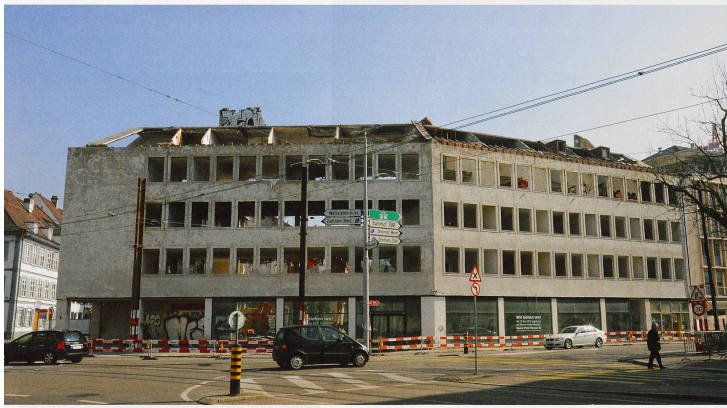
März 2013: Abriss des Burghofs gegenüber dem Kunstmuseum.

werbe und ruhebedürftige Anwohner gegenseitig das Leben zur Hölle machen würden. In der Abstimmung vom November 2018 sprachen sich aber 60 Prozent der Basler Stimmberechtigten deutlich für das Vorhaben aus. Die Transformation kann also beginnen.