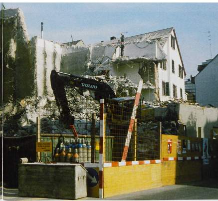
Abbruch der Klingentalmühle im Jahr 2000.