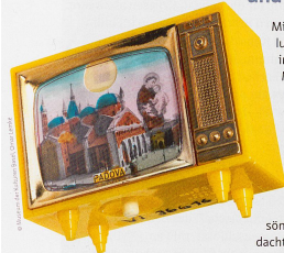
Andenken an eine Reise oder Wallfahrt; Padua, Italien; 1969

26. Juni–5. Juli 2024, Museum der Kulturen Basel, Augustinergasse 2 → mkb.ch