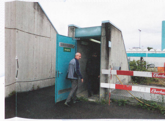
◀ Der Zugang zum Abwasser

▲ Mehr als 78 000 Kubikmeter Abwasser reinigt die Pro Rheno pro Tag.