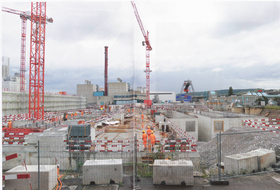
Mit der neuen Anlage können in Zukunft auch Stickstoffe aus dem Abwasser eliminiert werden.

überschreitungen bei den ungelösten Stoffen und beim gelösten organischen Kohlenstoff. Dieser nicht sehr befriedigende Zustand wird mit der Inbetriebnahme der neuen Anlage nun bald behoben.