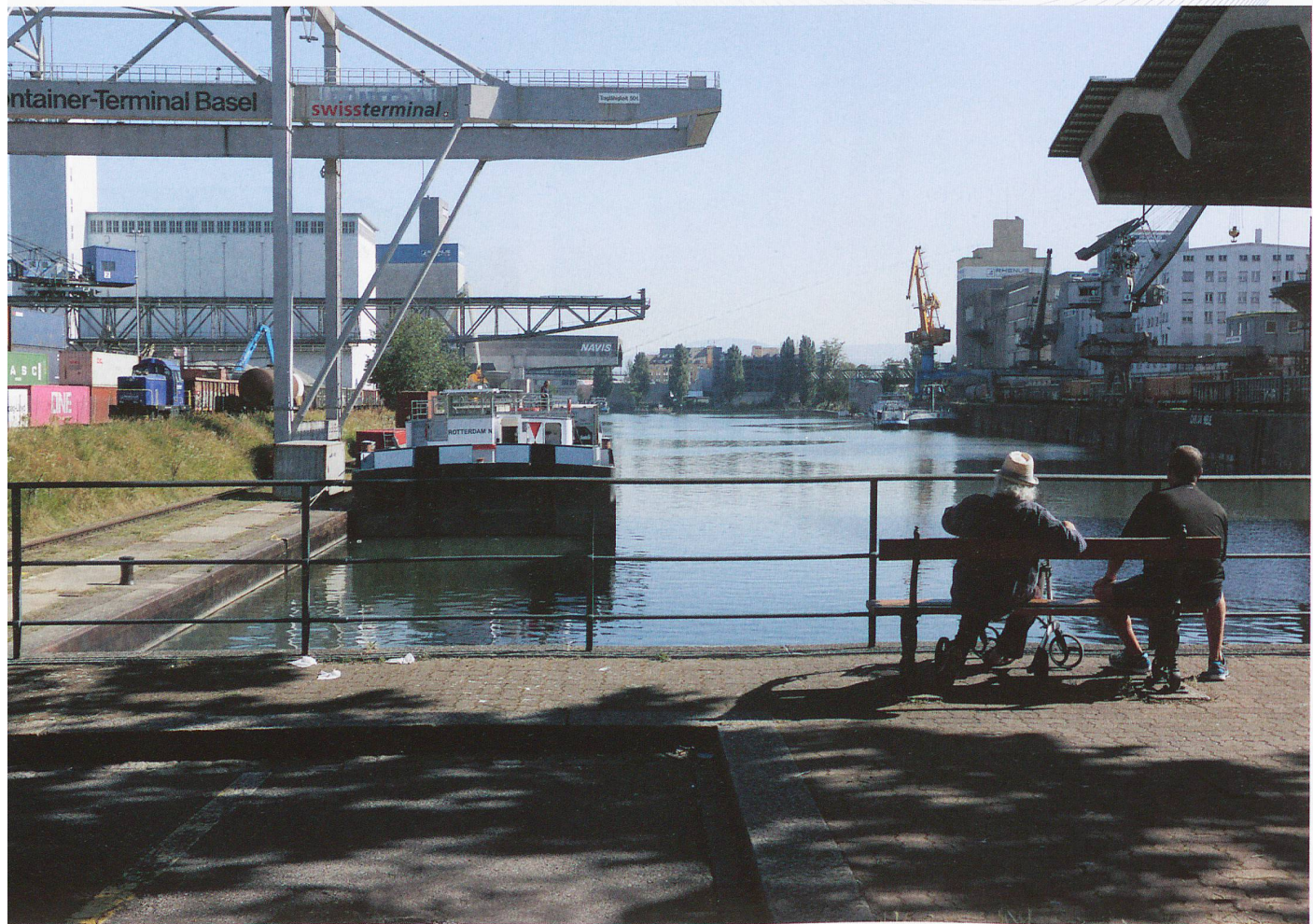
Impressionen des Basler Rheinhafens