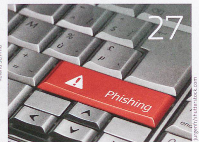
Gefährliche Tasten ...

bajour 21 Von analogen zu digitalen News