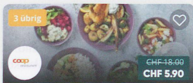
Coop Restaurant - Coop City Marktpl...