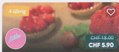
Bäckerei Kübler - Basel Lothringerstr...