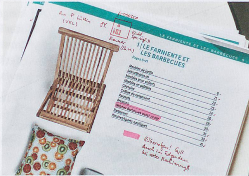
▲ Die Textkorrekturen werden bei der Rotstift AG seit 2019 nicht mehr traditionell von Hand auf Papier, sondern ...

Kaum ein Unternehmen kann es sich heute noch leisten, die Digitalisierung zu ignorieren. Kleinere Betriebe verfügen aber oft nicht über genügend Ressourcen, um die digitale Transformation aus eigener Kraft zu bewältigen. Sie erhalten in unserer Region Unterstützung von der Initiative «be-digital» der Handelskammer beider Basel.