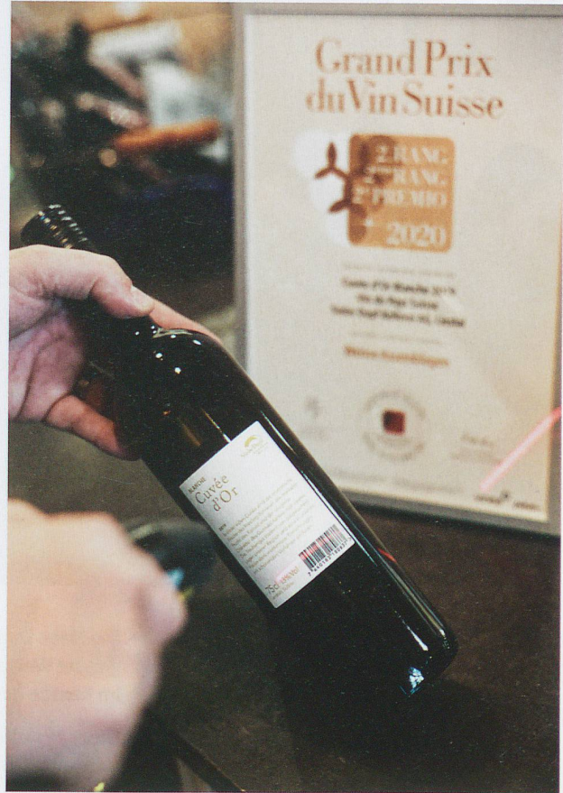
Auf der Weinflasche gibt es den Barcode schon, doch in der Logistik der Siebe Dupf AG wird er noch nicht verwendet.

Noch nicht so weit wie der rote Stift ist der rote Stab. Das bald 150-jährige Liestaler Traditionsunternehmen Siebe Dupf mit Sitz in Liestal und Enothek in Ba-