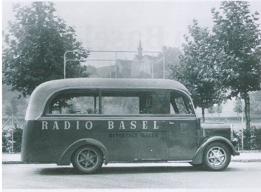
Reportagewagen des Basler Radios vor der Margarethenkirche