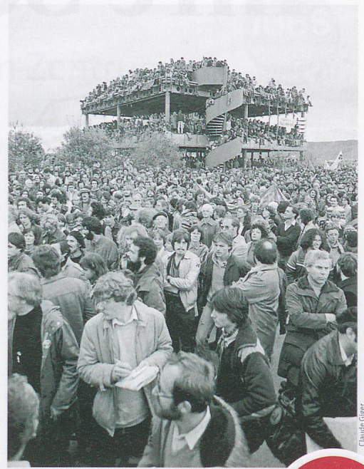
AKW-Gelände Kaiseraugst, Oktober 1981

Die Broschüre Liestals Vorstadt West/Nordwest kann im Buchhandel oder direkt beim Verlag Drehscheibe Liestal, Goldbrunnenstr. 43, 4410 Liestal, bezogen werden.