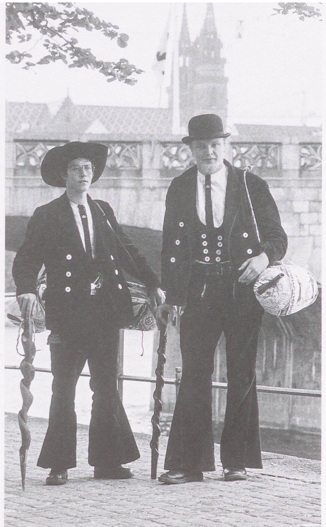
Ende Mai 1980: Viele reisende Handwerksge­sell­en besuchten damals Basel für den traditionellen zweitägigen Kongress.