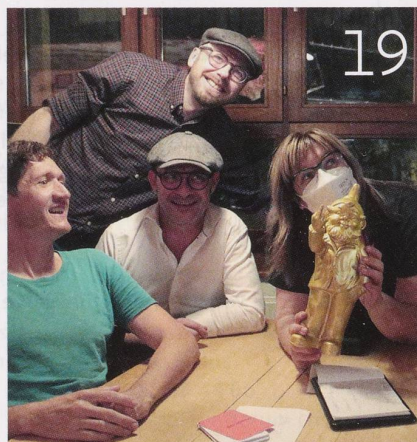
Erster Preis für die meisten richtigen Antworten im Pubquiz: der goldene Gartenzweig