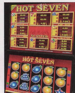
Spielsucht ist eine Krankheit.