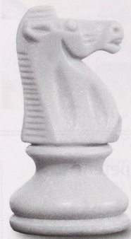
Schach: Mit Strategie und Konzentration