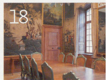
Der Basler Bürgerratssaal