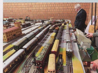
Felix Raber / Kosmos space