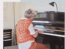
Felix Raber / Kosmos space