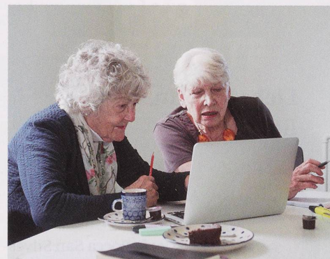
Felix Raber / Kosmos space