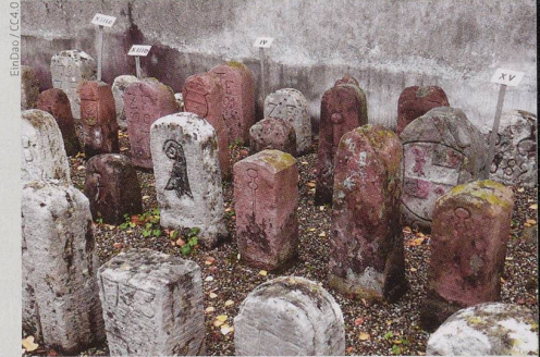
Alte Grenzsteine innerhalb der Ringmauer der Wehrkirche St. Arbogast in Muttenz.

Die Ausgabe 2/2022 erscheint Anfang April mit dem Schwerpunktthema «Gemeinden».