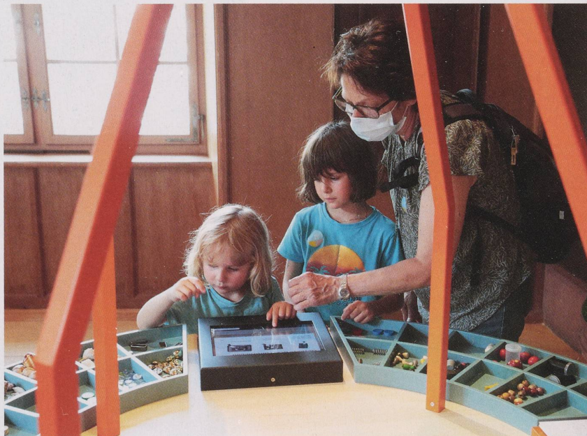
▲ Der Nachmittag vergeht im Flug, da zahlreiche Spielstationen die Neugier der Kinder wecken.