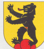
▲ Arisdorf Das Wappen der Gemeinde zeigt das Siegel der letzten adligen Dorfbesitzer, der Herren von Bärenfels.

Die Fusion der zwei Gemeinden Biel und Benken zu Biel-Benken ist bis heute die einzige im Kanton Basel-Land geblieben. Selbst kleinste Gemeinden wie etwa Liedertswil (BL) pochen nach wie vor auf Eigenständigkeit (vergleiche Seite 11). Vielleicht folgt in weni-