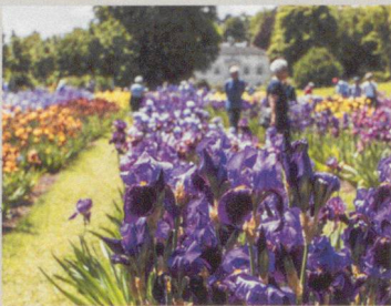
◀ Die Meriangärten in Brüglingen – einst der Sommersitz von Christoph Merian.

Das Bürgerliche Waisenhaus ist über 350 Jahre alt und führt heute Jugendliche nach modernen sozialpädagogischen Grundsätzen in die Selbstständigkeit.