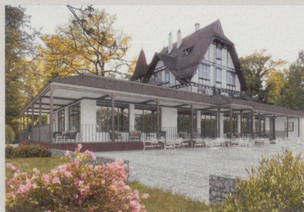
Visualisierung Waldhaus (Architektur: Rolf Stalder AG)

▲ Das renovierte Restaurant Waldhaus öffnet im Herbst wieder (Visualisierung).