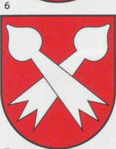
6 Bottmingen Das Bottminger Wappen gibt es seit 1943. Es zeigt das Siegel des Basler Adelsgeschlechts Schilling, der zweiten Besitzer des Bottminger Schlosses.