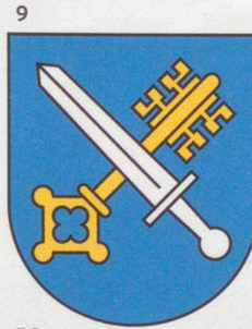
9 Allschwil (s. Seite 30)