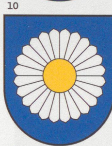
10 Rünenberg Die Rünenberger kamen im 19. Jahrhundert wegen der vielen in den Feldern wachsenden Wucherblumen (Margeriten) zum Spitznamen Margrite .