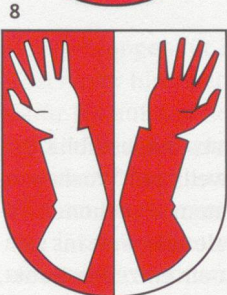
8 Sissach (s. Seite 8)