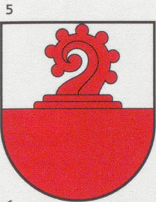
5 Liestal (s. Seite 6)