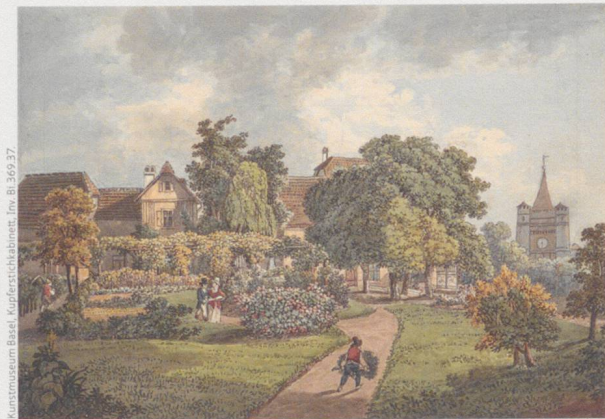
◀ Peter Birmann: Biedermeiergarten vor dem Spalenter, um 1840