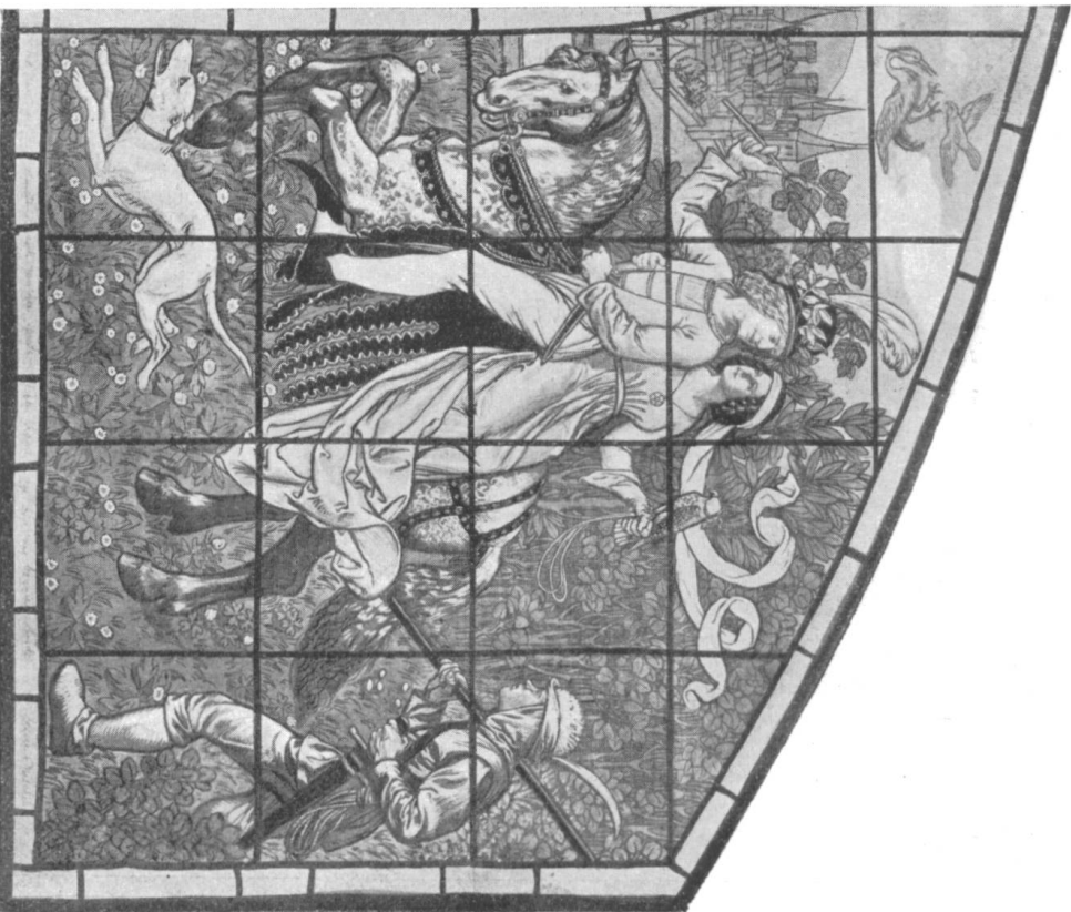
Glasgemälde für die Zunftkubde zu Mittel-Römen