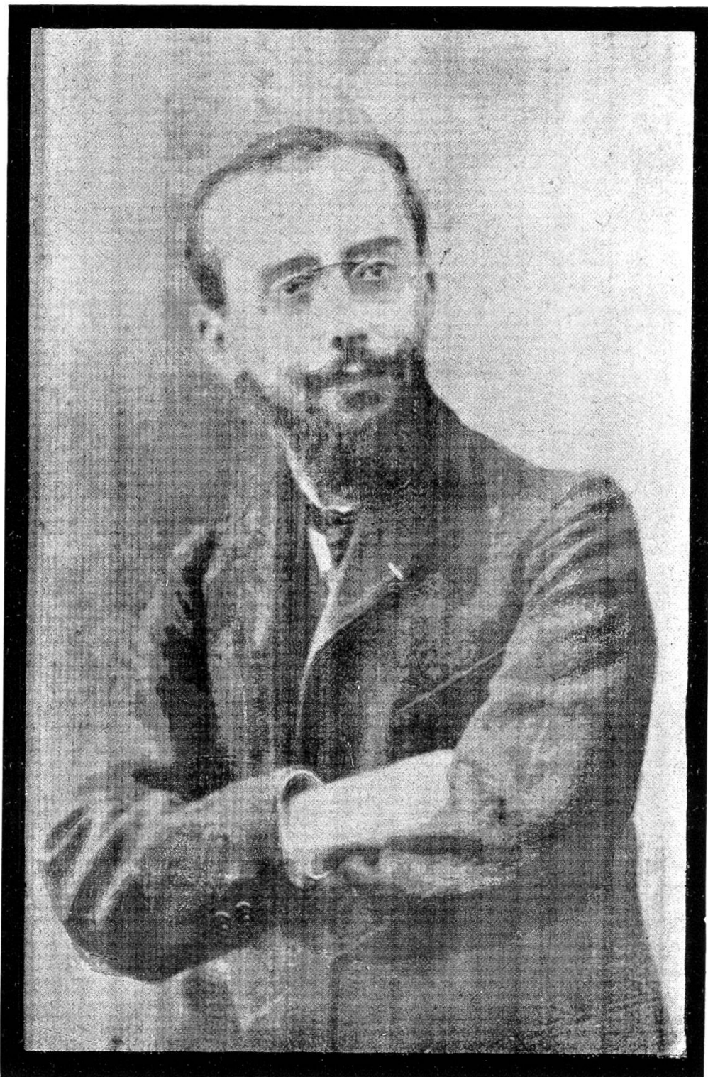
Abb. 7. FERNPHOTOGRAPHIE NACH BELIN