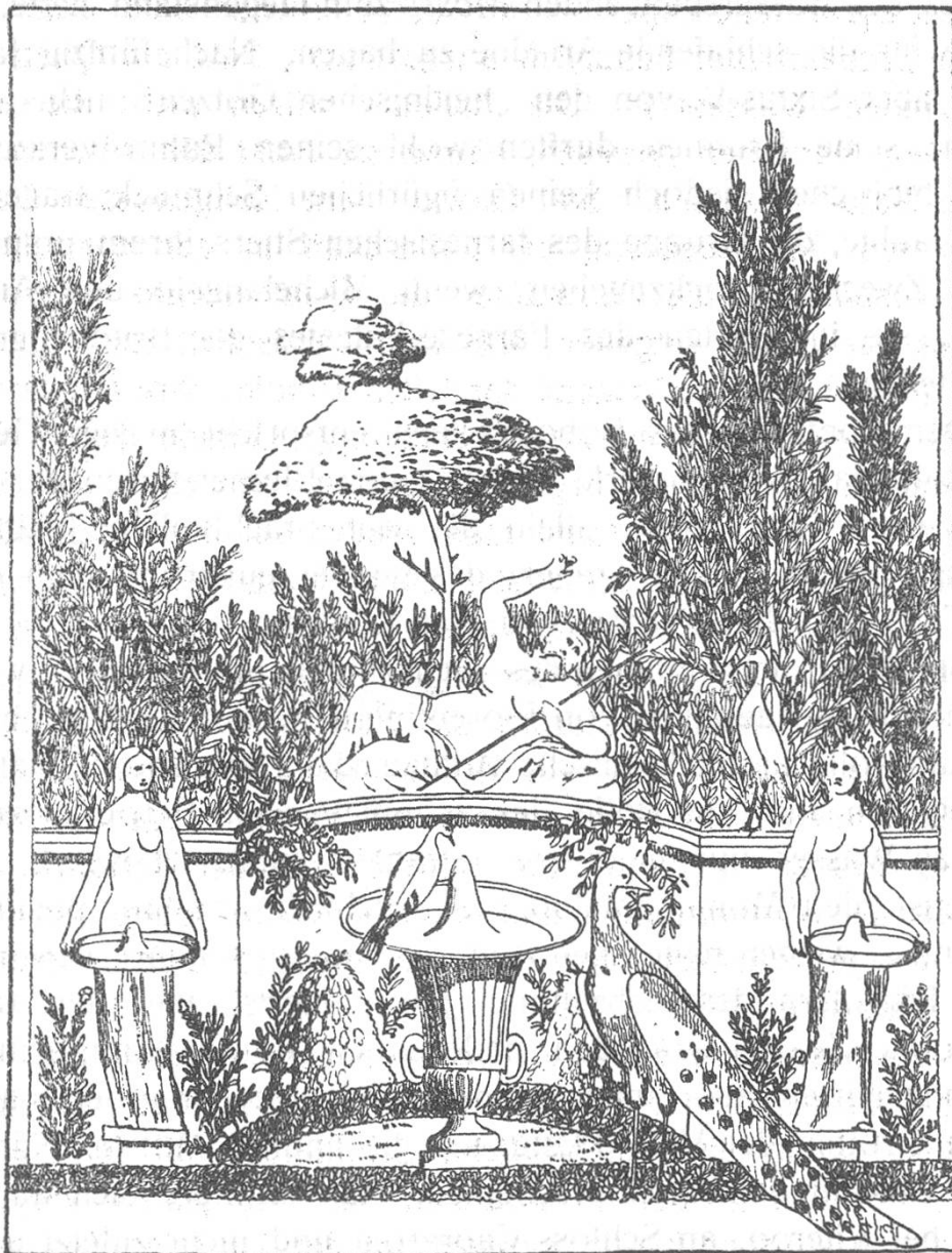
Antikes Wandbild eines Brunnens.

Labyrinth. Um aber den Zyklus dieser Lokalgöttheiten zu vervollständigen, gehörten dazu die Personifikationen des Arno und Mugento, der Falterona und der Stadt Fiesole, und ganz entsprechend thronte in der Villa d'Este zu Tivoli über dem Teich und seiner Nischeneinfassung die Nymphe Alburnea, im grünen