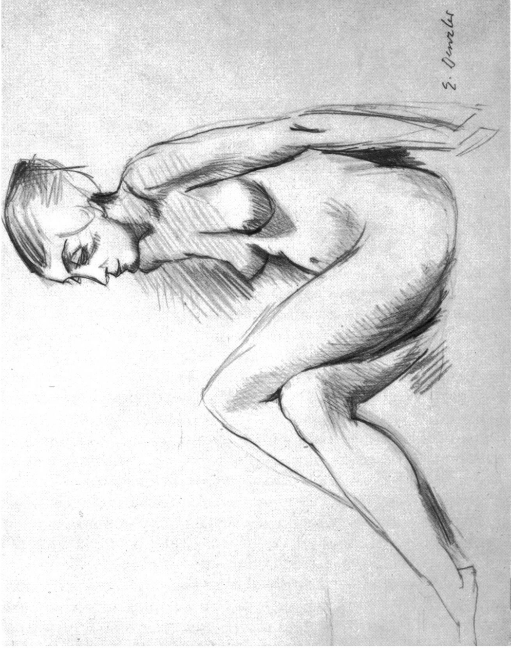
ERNST DENZLER / ZEICHNUNG