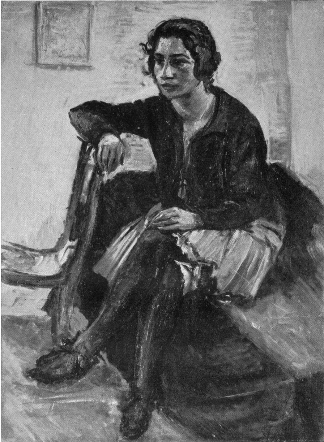
ERNST DENZLER / PORTRÄT