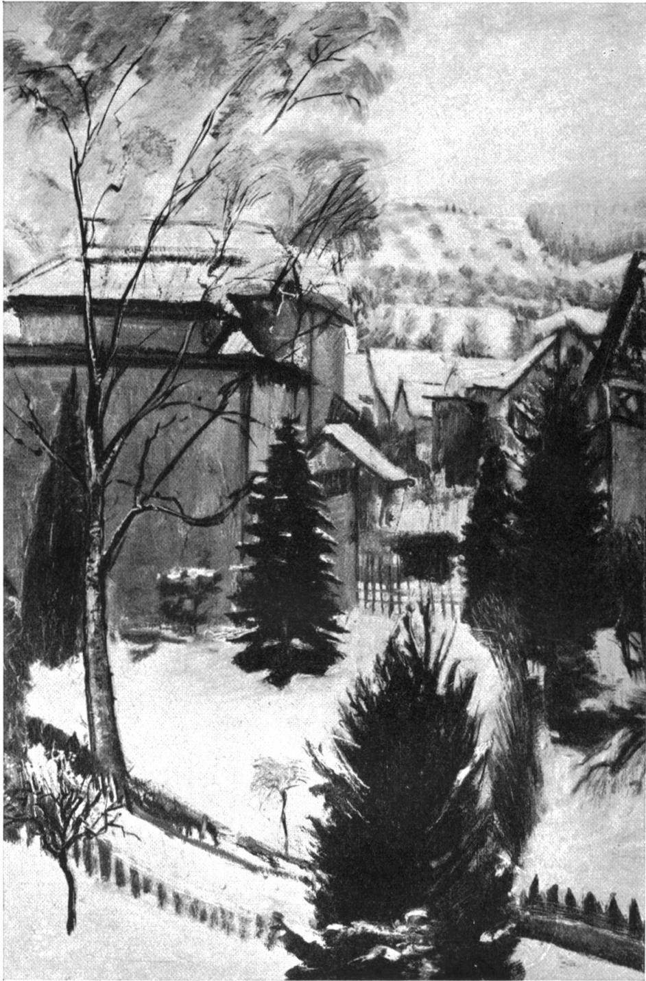
ERNST DENZLER / WINTERLANDSCHAFT