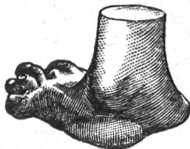
NUR NACH MASS

RENNWEG 29 / TELEPHON S. 4160 / ZÜRICH 1