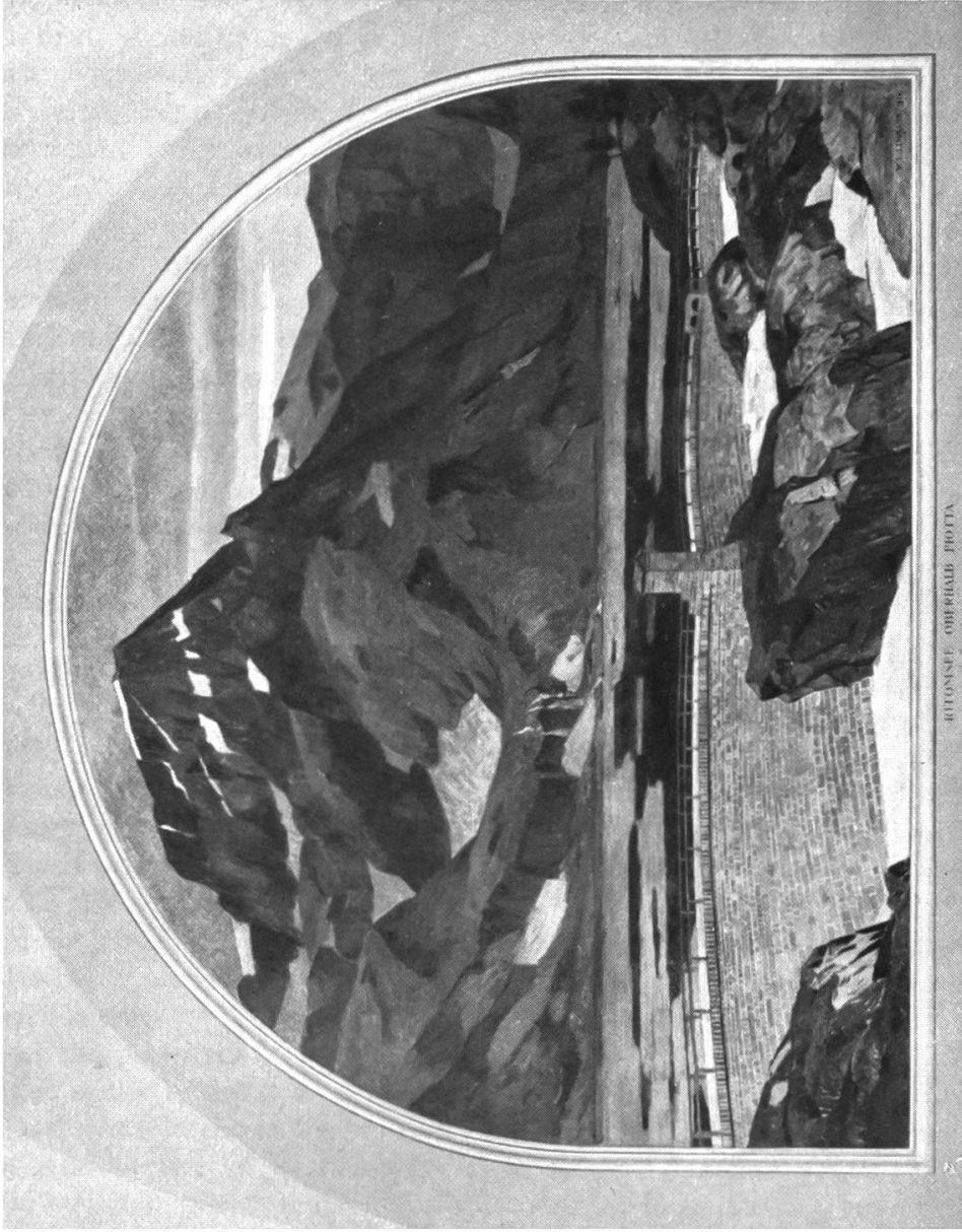
ROTUNDE - OBERHADE - FROTTA