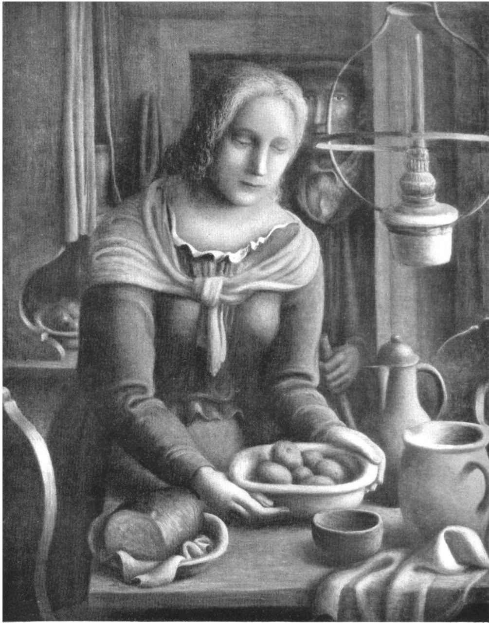
EDUARD GUBLER / DAS MAHL