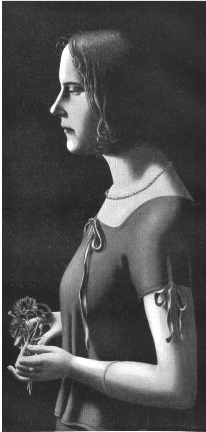
EDUARD GUBLER / BILDNIS M. G.