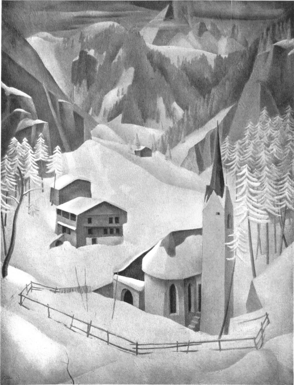
EDUARD GUBLER / SCHNEELANDSCHAFT