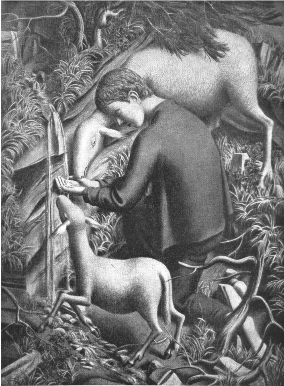
EDUARD GUBLER / HIRTENKNABE