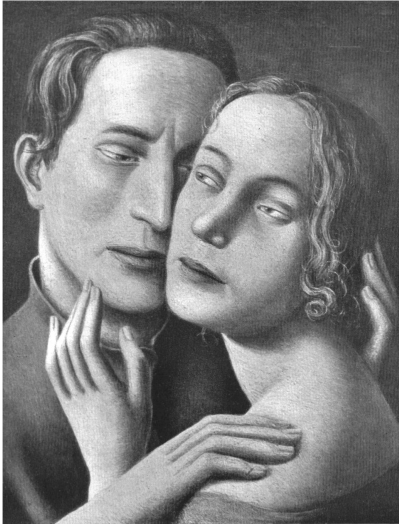
EDUARD GUBLER / LIEBESPAAR