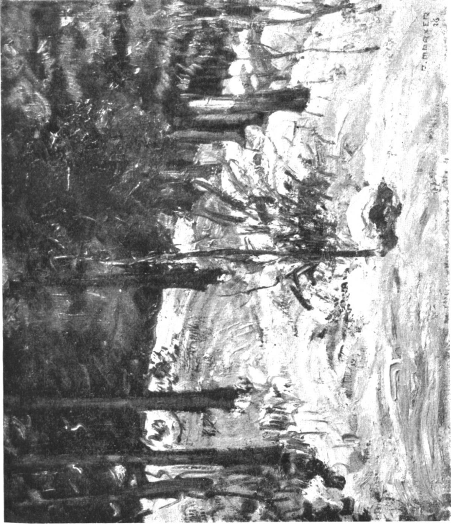
A. MARXER / WALDEINGANG IM WINTER