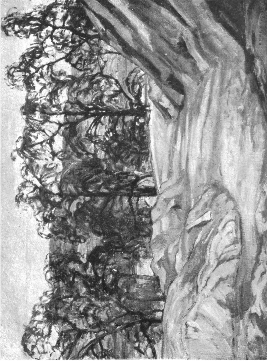
A. MARXER / VORFRÜHLING ÜBER DEM SEE