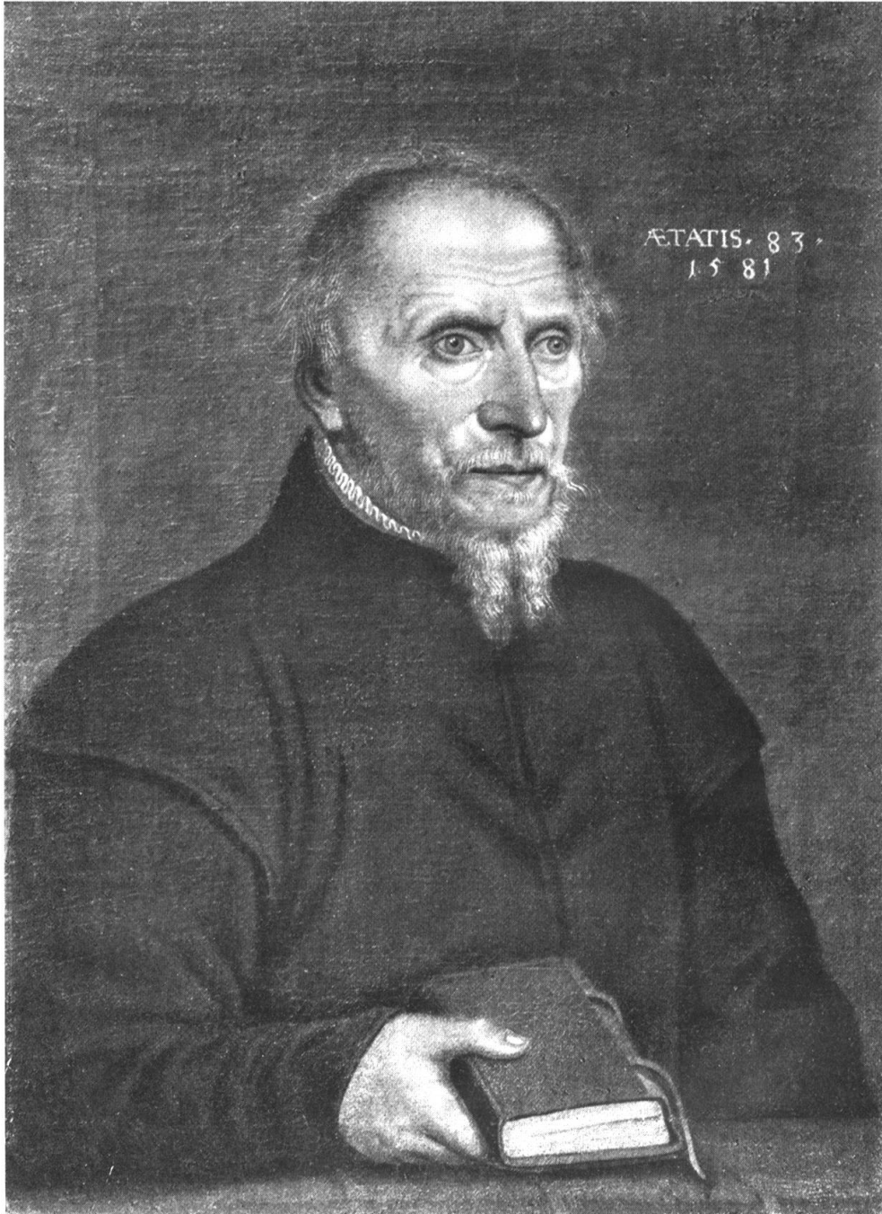
BILDNIS THOMAS PLATTERS VON HANS BOCK (1581).