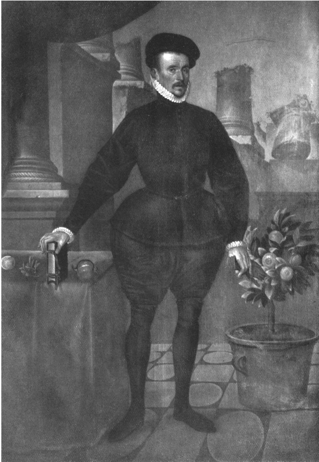
BILDNIS FELIX PLATTERS VON HANS BOCK (1580). (Öffentliche Kunstsammlung Basel)