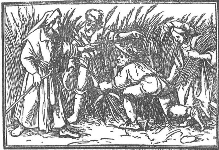
HANS HOLBEIN, BOAS UND RUTH