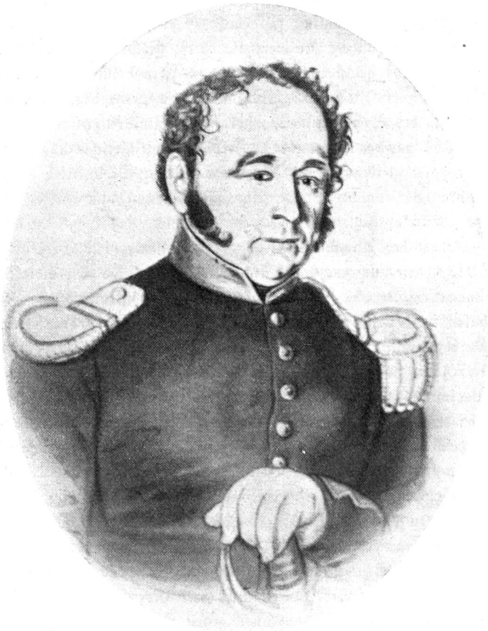
Kommandant Christian Delhafen Vergrößert nach einer Photographie

nachrückenden Abtheilungen des aargauischen Landwehrebataillons Delhafen auf so respectable Distanz genährt wurde, daß man ziemlich viel Pulver verpuffte, ohne daß auf irgend einer Seite ein Tropfen Blut vergossen worden wäre. Unglücklicherweise aber wurde durch das Feuer unserer Artillerie eine Scheune, bei