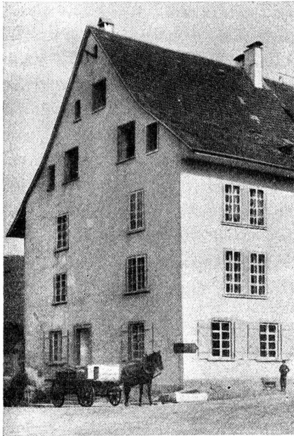
Post in Aarau von 1805—1859

führung des Baues und schließlich entthob die Übernahme der Posten durch den Bund auf 1. Januar 1849 den Kanton der