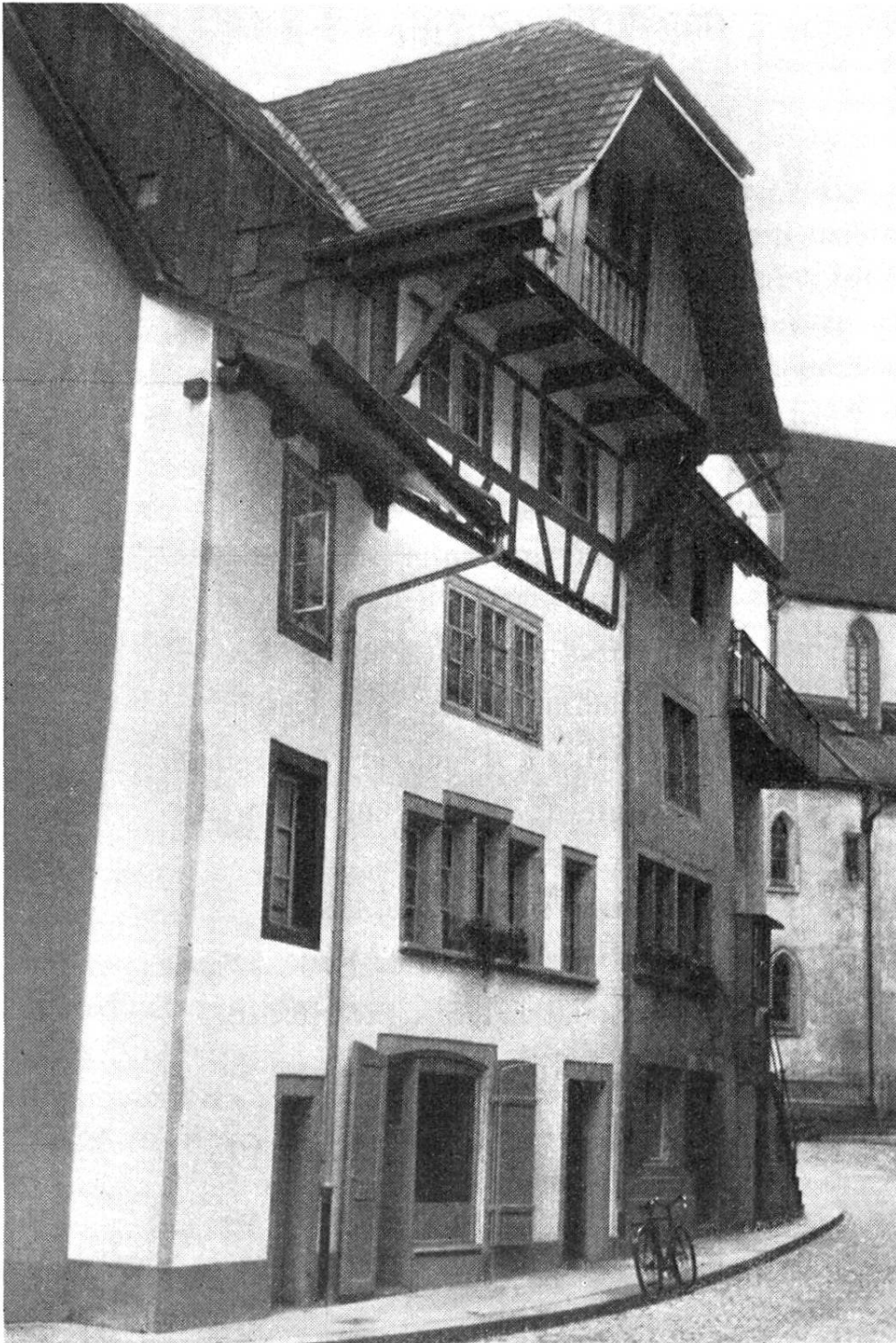
Adelbändli, das renovierte Haus Nr. 3