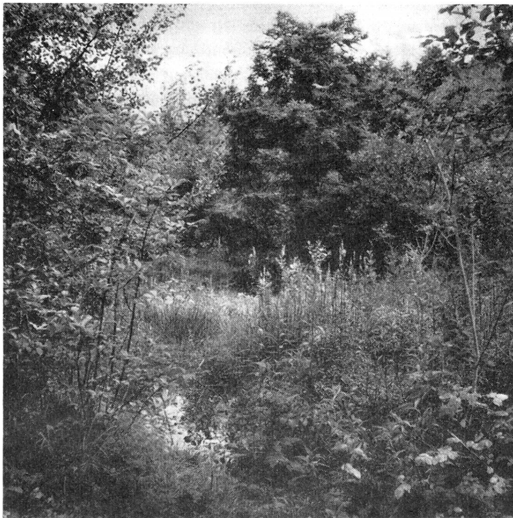
Am Waldrand gegen das Luegisland

zu der Gemeinde, die ihn ins Bürgerrecht aufnehmen soll, Beziehungen hat, wie sie vor allem durch lange dauernden Wohnsitz begründet werden. Im Gegensatz dazu ging das Bestreben der meisten Orts-