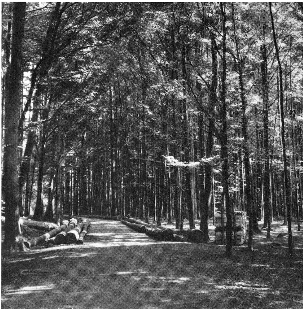
Sönhard, Waldeingang des Schwirrenmattsträßchens

Armenunterstützung meist der Freiwilligkeit überlassen und war Sache des Grundherrn oder der Kirche. Der Unterstützungsbedürftige mußte seinen Grundherrn um Almosen bitten und war von