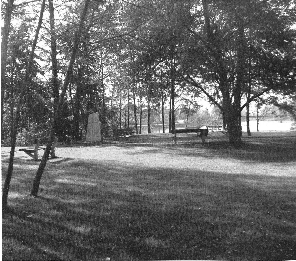
Die neuen Anlagen auf der Insel beim Zurlindensteg mit dem Gedenkstein