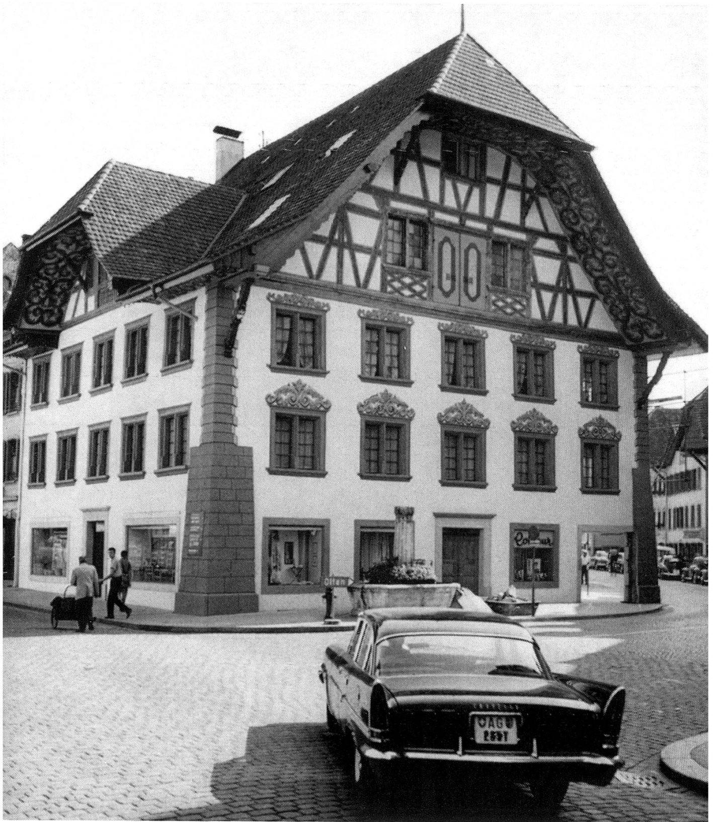
Das fachgemäß renovierte Saxerhaus (Vordere Vorstadt Nr. 8) erscheint erstmals urkundlich am 15. Januar 1344 als Spital, in welchem Schwestern, vermutlich vom Dritten Orden des hl. Dominikus, wirkten und wo die Bürgerschaft vor dem 6. Juni 1364 einen St.-Nikolaus-Altar für einen speziellen Spitalkaplan stiftete. Ab 1533 beherbergte das Haus auch Aaraus erste deutschsprachige Schule. Seine heutige Gestalt erhielt das Haus 1693, als das Spital ins ehemalige Haldenkloster disloziert war. Jahrhundertlang bildete es den Scheitelpunkt einer vermutlich vor Aaraus Stadtgründung zurückgehenden Flurgrenze, genannt «zen Husen».