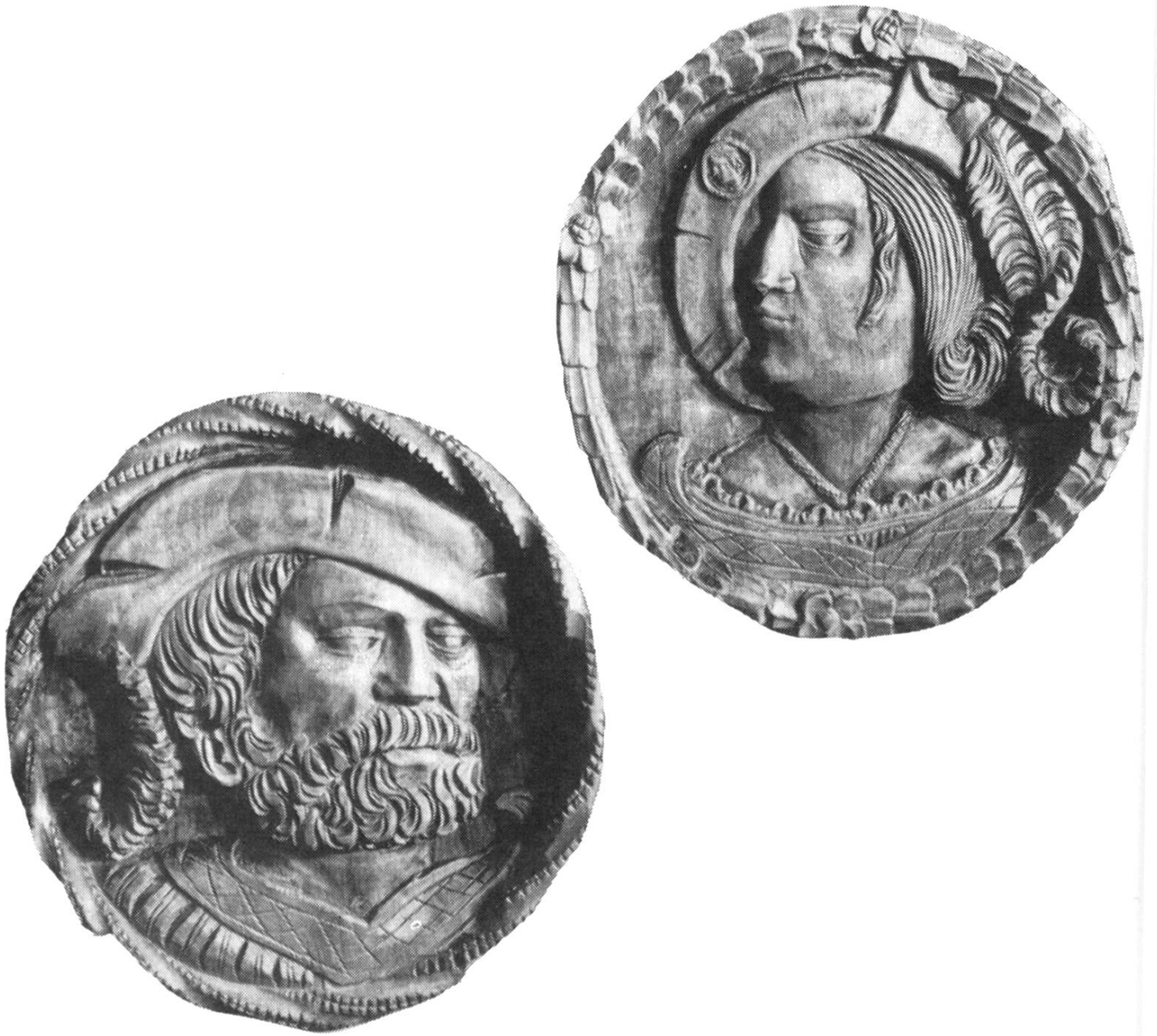
Deckenmedaillons aus dem Jahre 1519, ursprünglich im Rathaus, heute im Schlössli. Die Figuren in zeitgenössischer Tracht erinnern an die kraftvollen Gestalten eines Urs Graf und eines Niklaus Manuel.