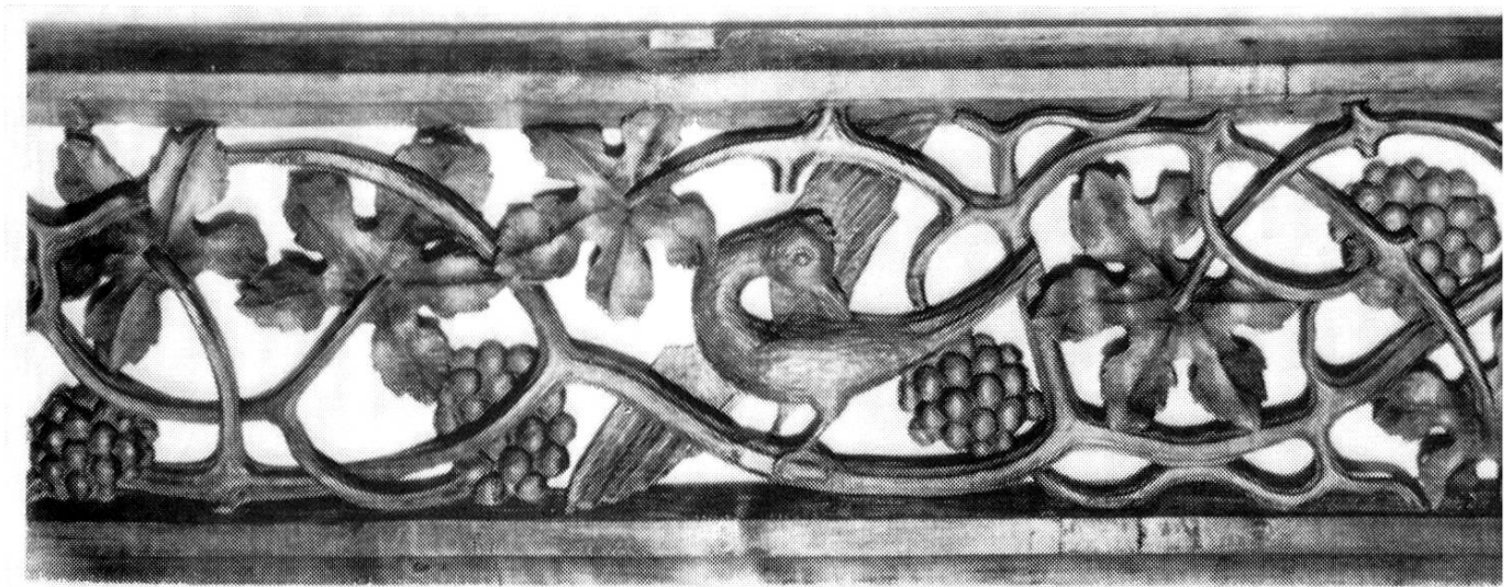
Täferschnitzereien aus den alten Aarauer Ratsstuben aus dem Jahre 1519