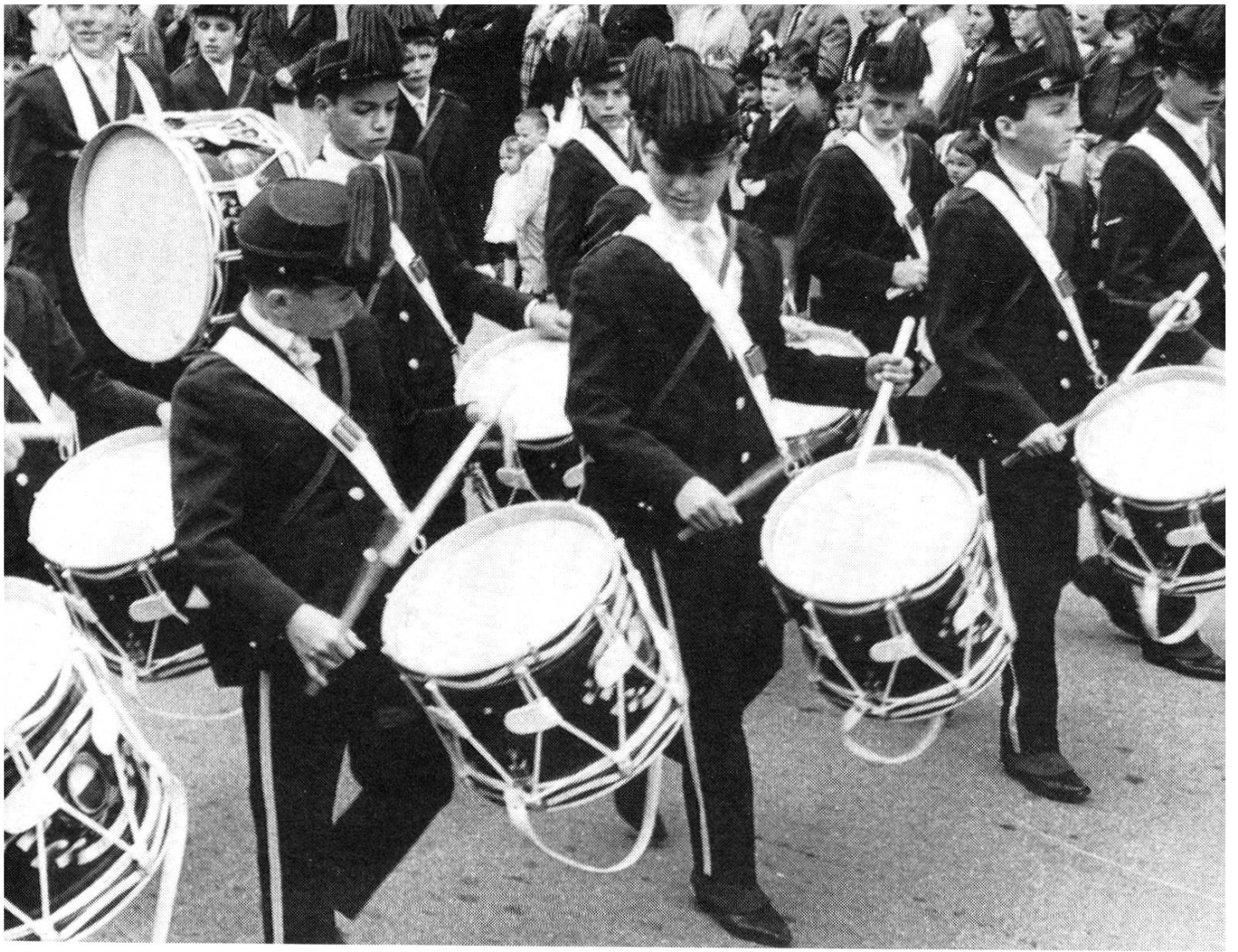
Die «Fifres et Tambours des Collèges secondaires de Lausanne» (oben) waren eine der Besonderheiten des grauen Maienzuges 1965. Das untere Bild entstand zur Zeit der Festansprache in der Telli.