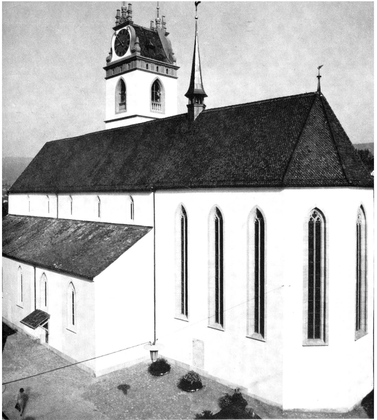
Die Stadtkirche wurde innen und aussen gründlich renoviert und in den ursprünglichen Zustand zurückgeführt; man beachte das schlichte Portal.