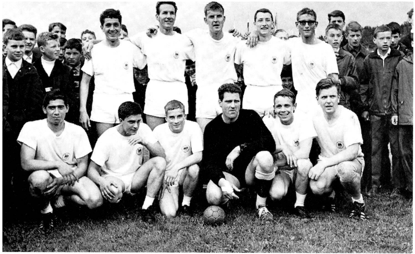
Die erfolgreiche Aarauer Handball-Mannschaft nach dem Sieg im Agfa-Cup. Beat-Konzert im Saalbau: Modeströmungen in bezug auf Musik und Frisur machen auch vor unserer Stadt nicht halt.