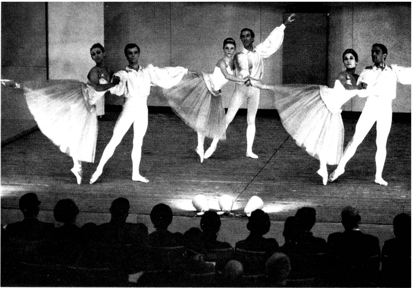
Im Kunsthaus fand eine Ausstellung über «Ballett und Bühnenbild» statt. Dem Thema entsprechend tanzte an der Vernissage das Schweizerische Kammerballett. Der Zürcher Stadtpräsident Sigmund Widmer eröffnete die Ausstellung «Zürcher Künstler stellen in Aarau aus». Gleichzeitig stellten in Zürich Aargauer aus.