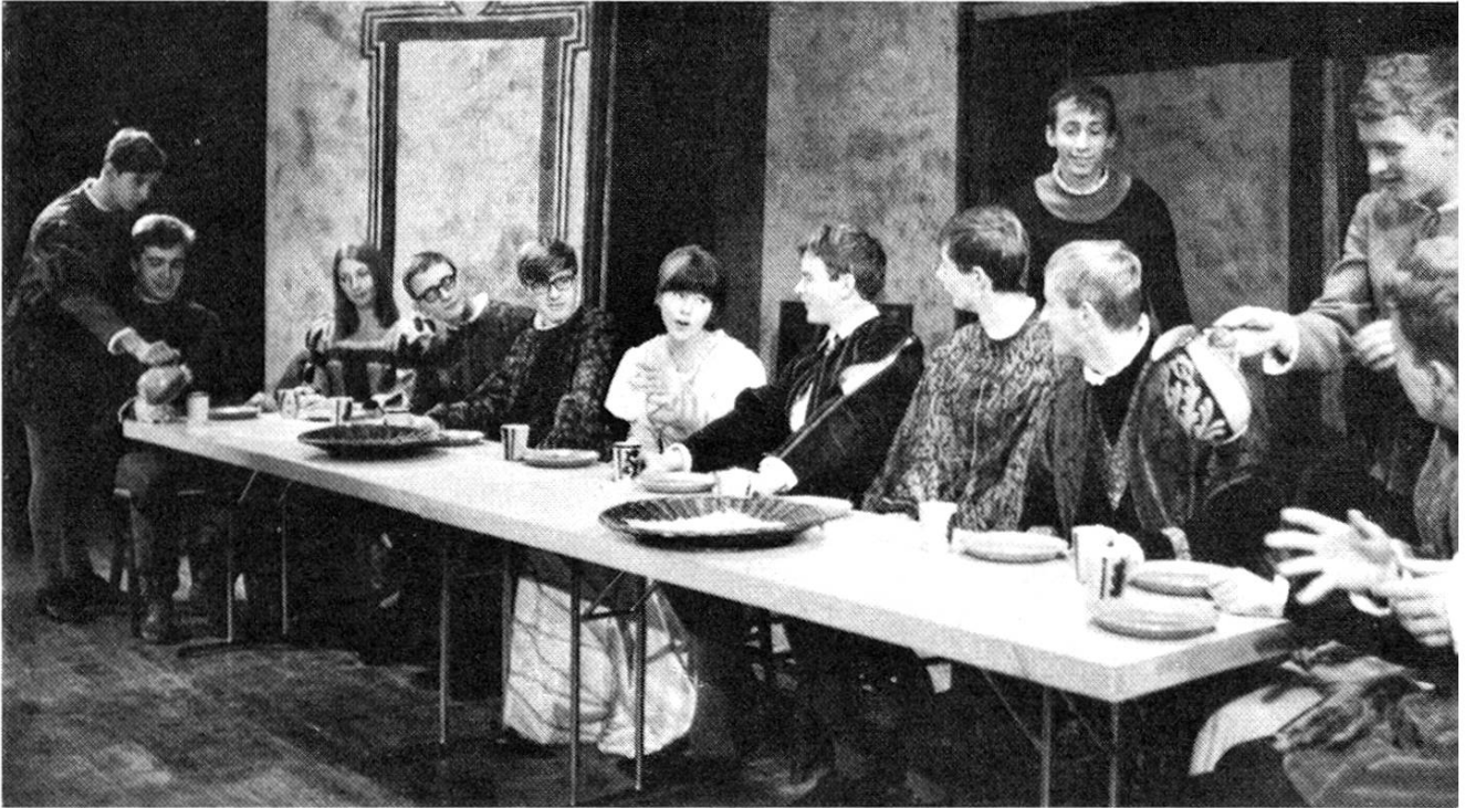
Die Aarauer Kantonsschüler spielten an ihrem öffentlichen Theaterabend Shakespeares «Der Widerspenstigen Zähmung».