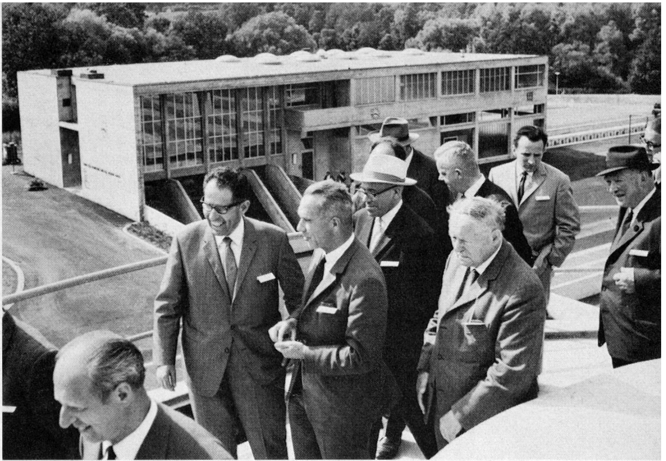
Die regionale Abwasserreinigungsanlage in der Telli konnte in Betrieb genommen werden. Oben ist das Maschinenhaus und unten eines der Belüftungsbecken zu sehen. Damit hat unsere Region einen wertvollen Beitrag zum Gewässerschutz geleistet.