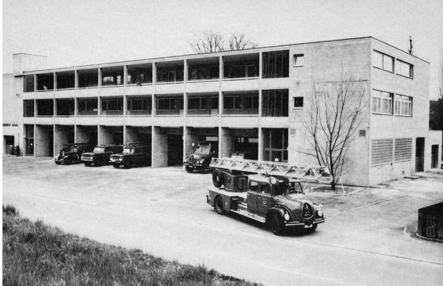
Die Aarauer Feuerwehr verliess ihr altes Gebäude (Tuchlaube) nach vielen Jahren des Wartens, und sie konnte ihre neue Unterkunft an der Erlinsbacherstrasse beziehen.