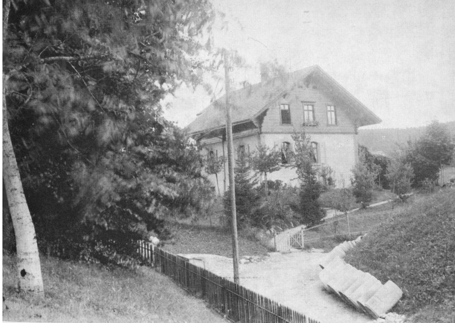
Die alte Hohl-gasse kurz vor dem Umbau, von Norden gesehen. An dieser Stelle kreuzen sich heute Hohl-gasse und Zelglistrasse.