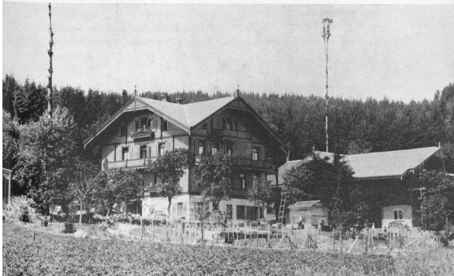
Das 1897 anstelle der alten Badewirtschaft errichtete Chalet im Binsenhof.