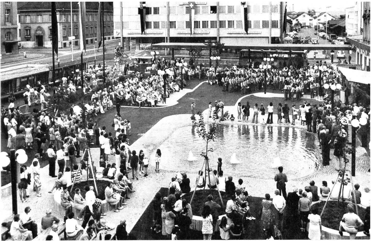
Aarau besitzt einen neuen Bahnhofplatz. Das Bauwerk wurde mit einem zweitägigen Fest eingeweiht