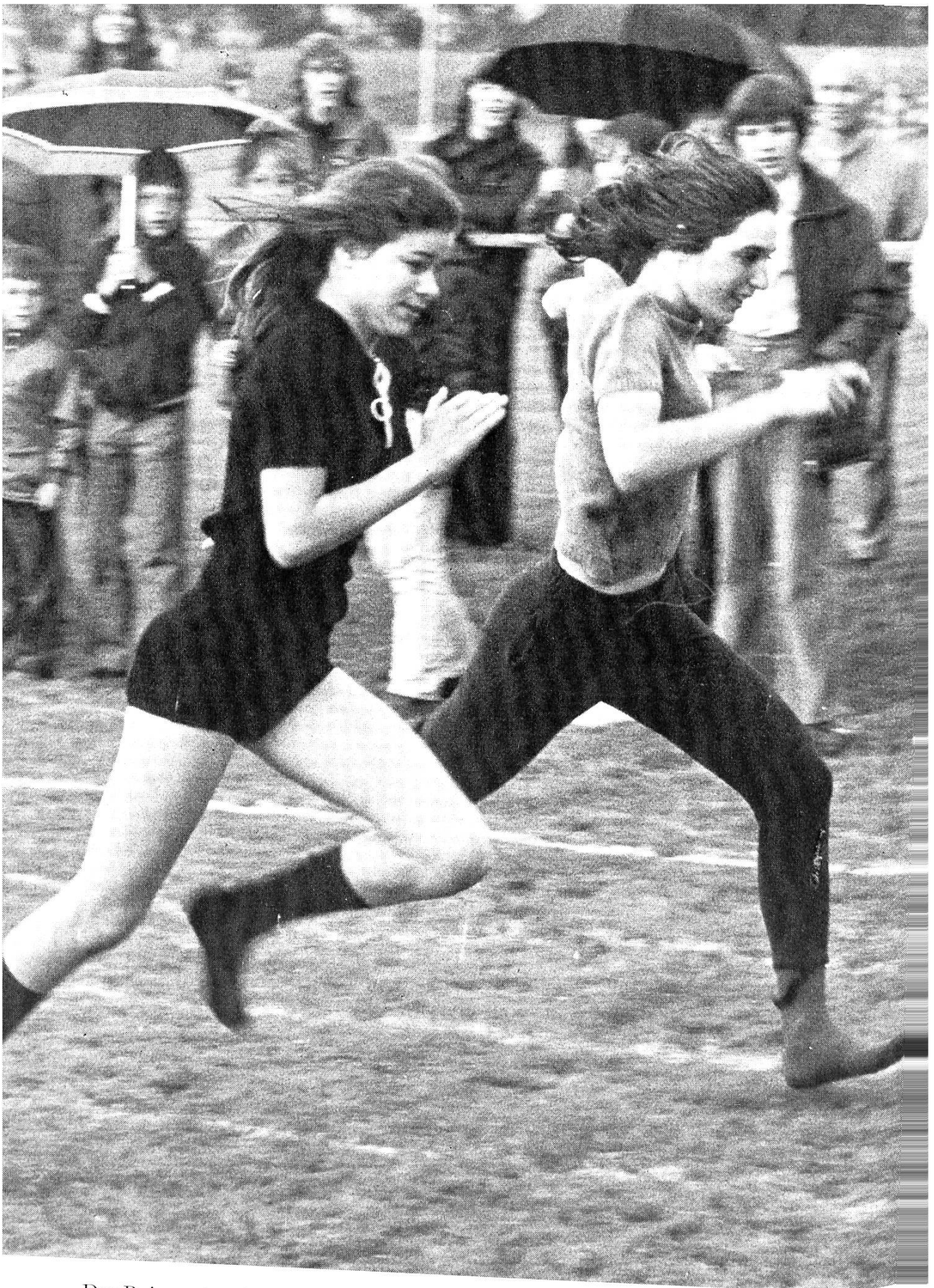
Der Reingewinn des Sportfestes in Suhr kam dem Altersheim zugute.