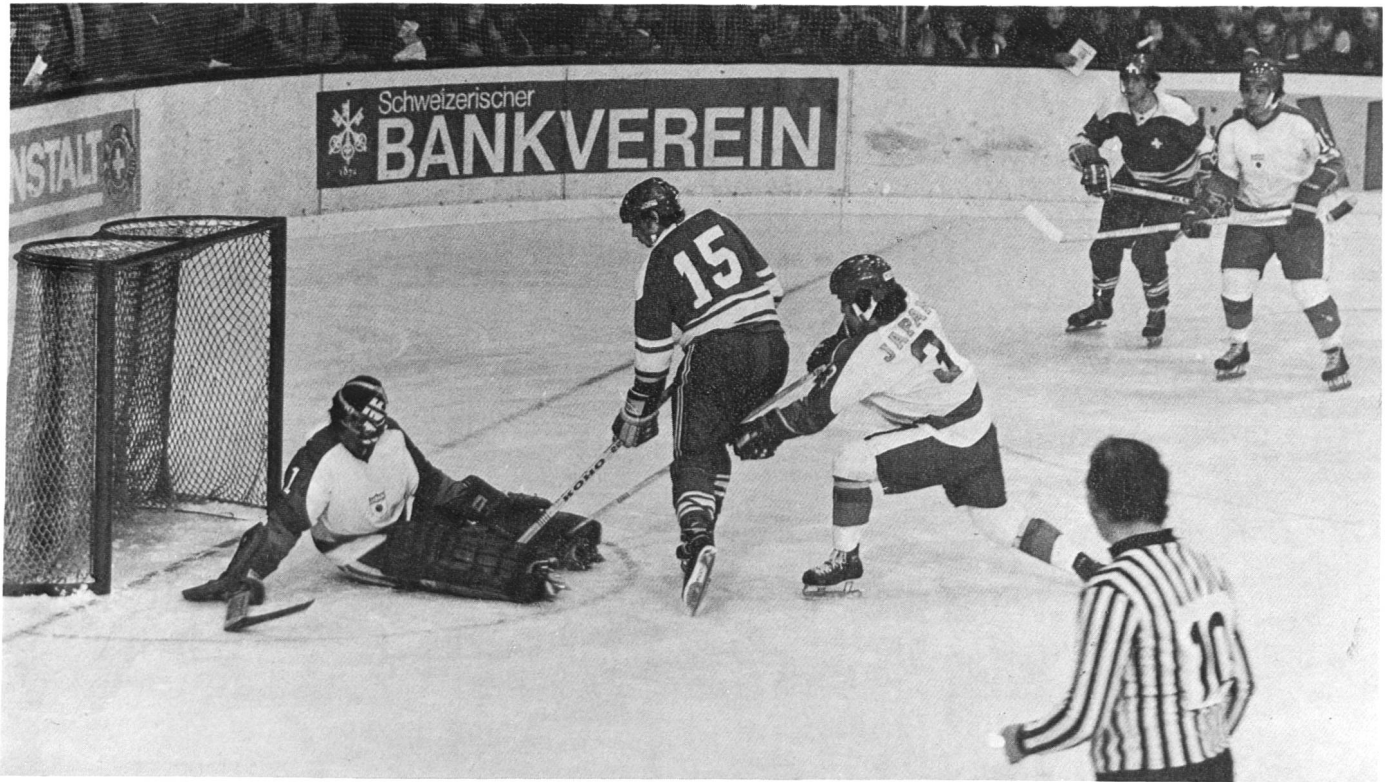
B-Turnier der Eishockey-Weltmeisterschaft auf der Aarauer Keba (aus dem Spiel Schweiz – Japan).