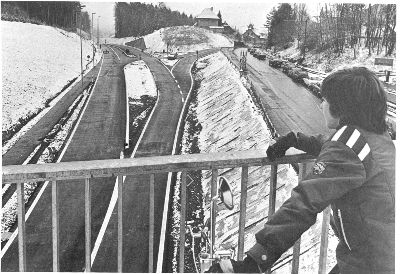
Der Autobahnzubringer Distelberg wird in Betrieb genommen.