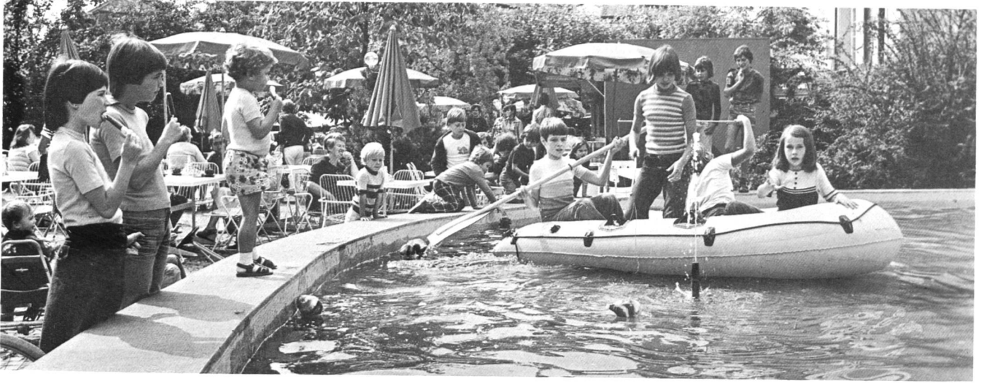
Eine Kantonsschulklasse führt ein «Wässerle» für Aarauer Kinder durch.