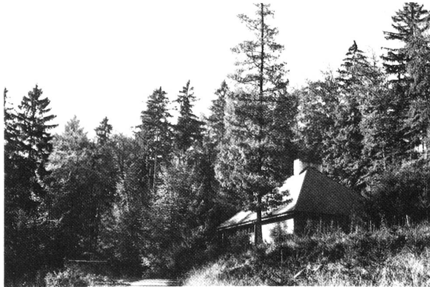
Ruhezeit in nachmittäglicher Herbstsonne.

Eine Anregung: Der Brunnen vor der Hütte spendet vom frühen Frühling bis über den ersten Frost zweieinhalb Liter klarsten Wassers pro Minute, die im Gelände westlich des Hüttenvorplatzes ungenutzt zerrinnen. Eben die richtige Wassermenge, ein Biotop zu speisen. Wer ergreift hier die Initiative? Er kann der Unterstützung durch die Hüttenbetriebskommission versichert sein.