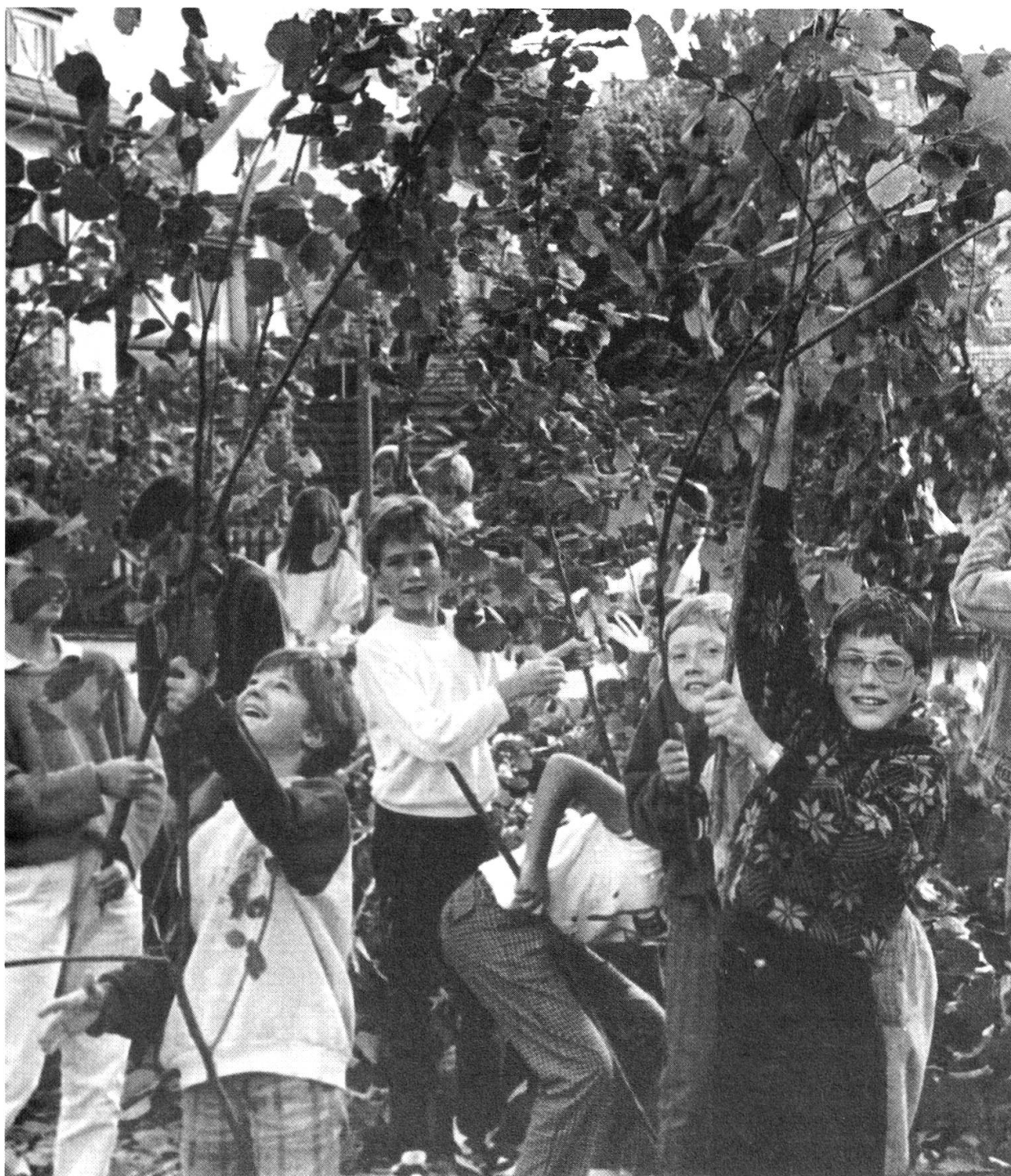
12 Bachfischet 1987: die Aarauer Schuljugend beim Holen der Haselruten.