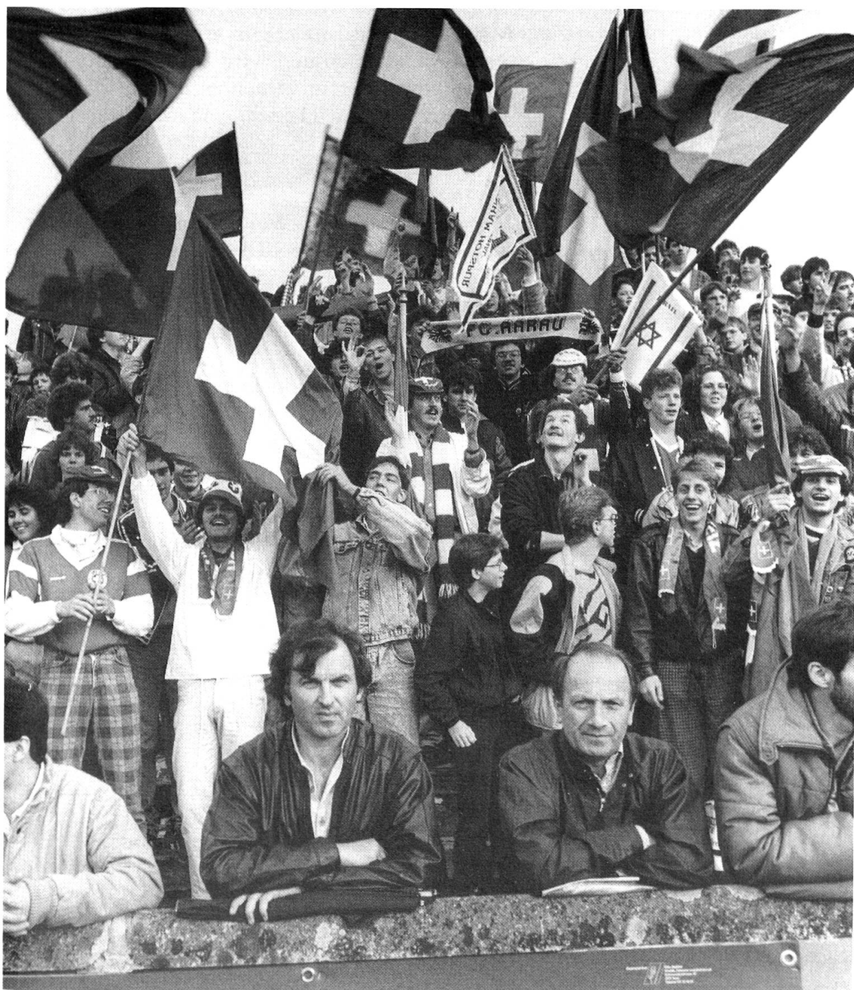
6 Länderspiel-Atmosphäre auf dem Brügglifeld: Schweiz–Israel im Mai 1987.