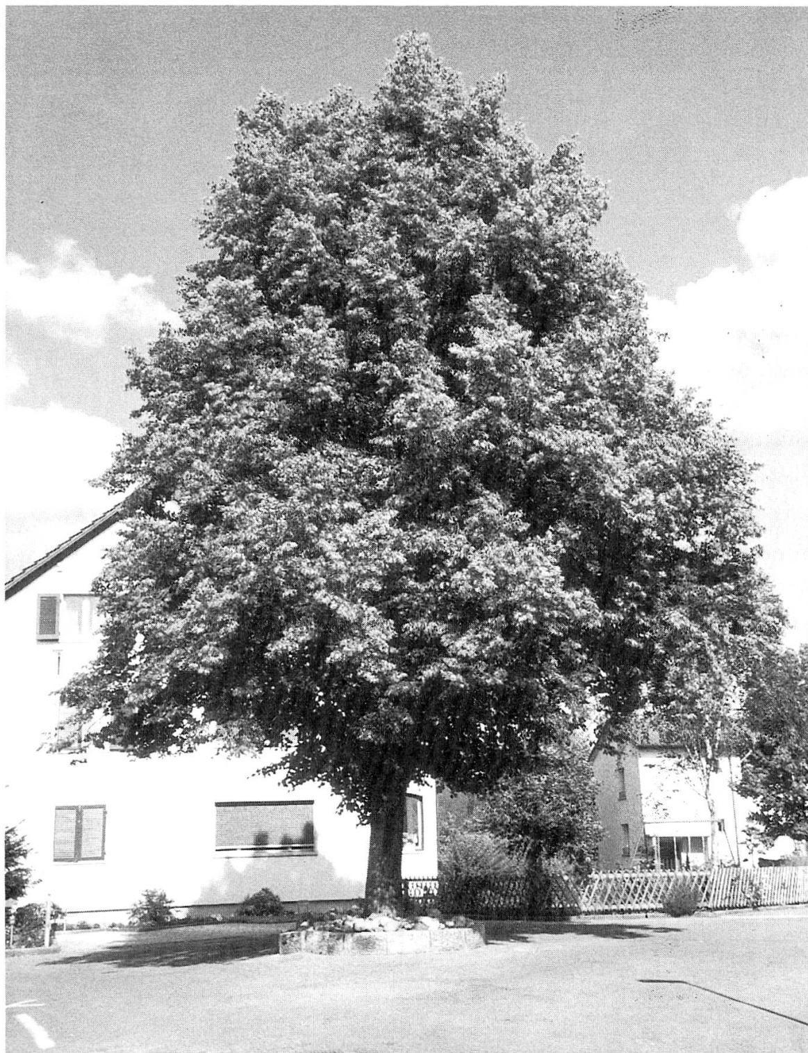
2 Die Dorf- und Gerichtslinde von Oberburg, das einst selbständige Gemeinde im heutigen Windisch war.