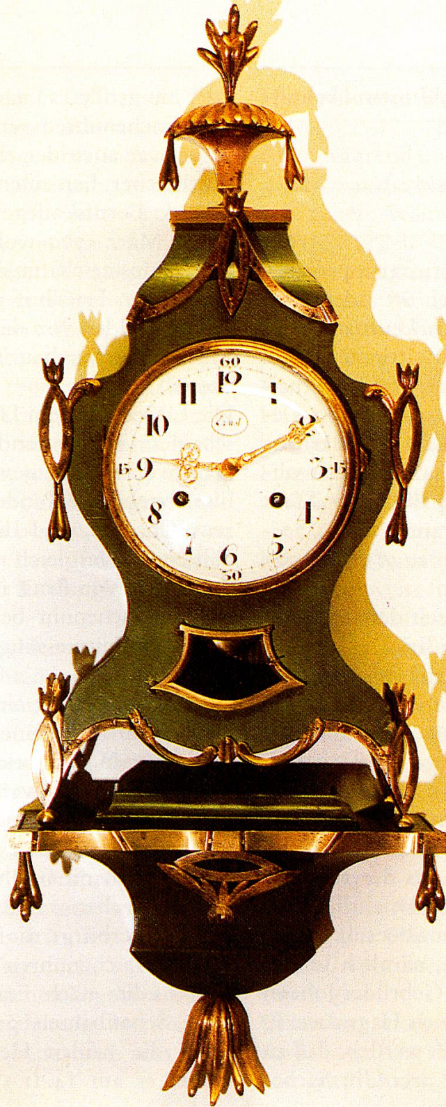
1 Pendule, Aarau, um 1785. Email-Zifferblatt sign.: Ernst. Spindelhemmung. 4/4-Stundenschlag auf zwei Glocken. Grün gefasstes Gehäuse mit Bronzeverzierung. Privatbesitz.