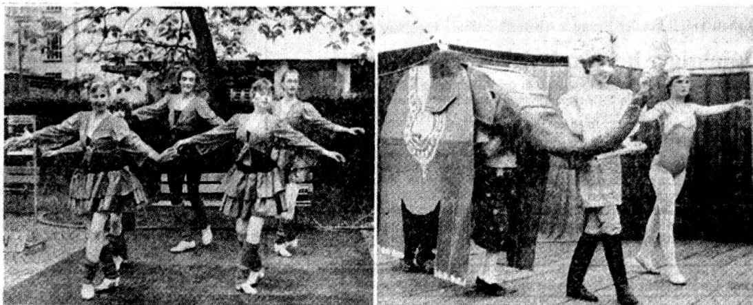
Unsere Bilder von den Volkstheatertagen in Aarau zeigen Steptanzvorführungen im Kasinopark (links) und eine Vorstellung des Zirkus «Sommervogel».