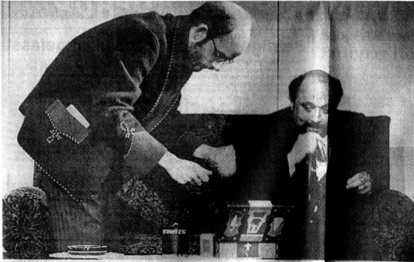
Die «Tuchlaube» war ausverkauft: Die Aarauer «Gaukrlaien» spielten zwei Komödien von Curt Götz.