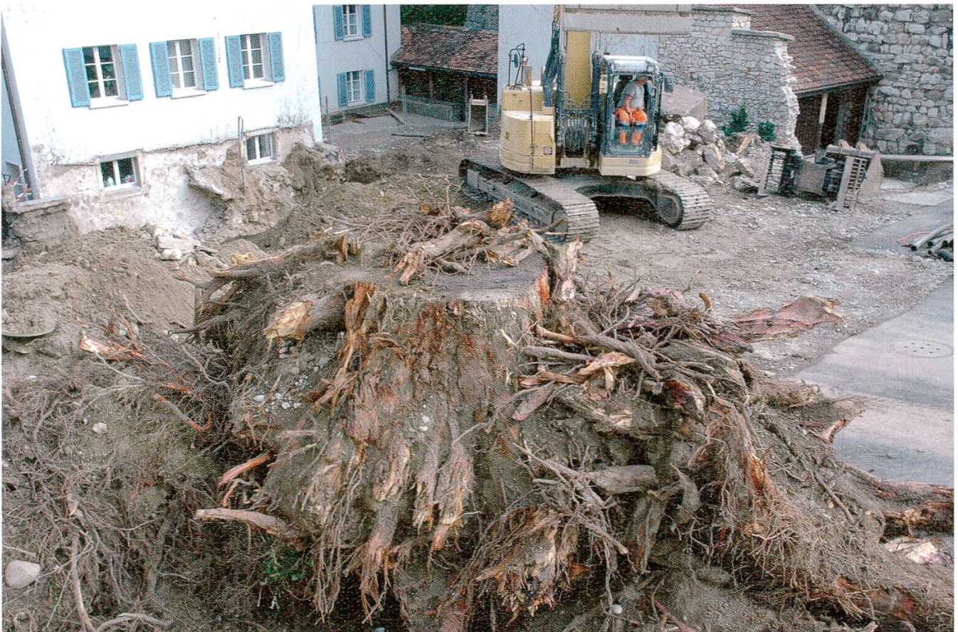
1 Die Bauarbeiten haben begonnen.

Das Eröffnungswochenende vom 24.–26. April 2015 schloss die dreijährige Bauzeit ab.